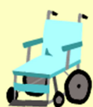
車いすと その付属品