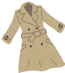
素材による花粉付着率 (綿を100とした時の比率)